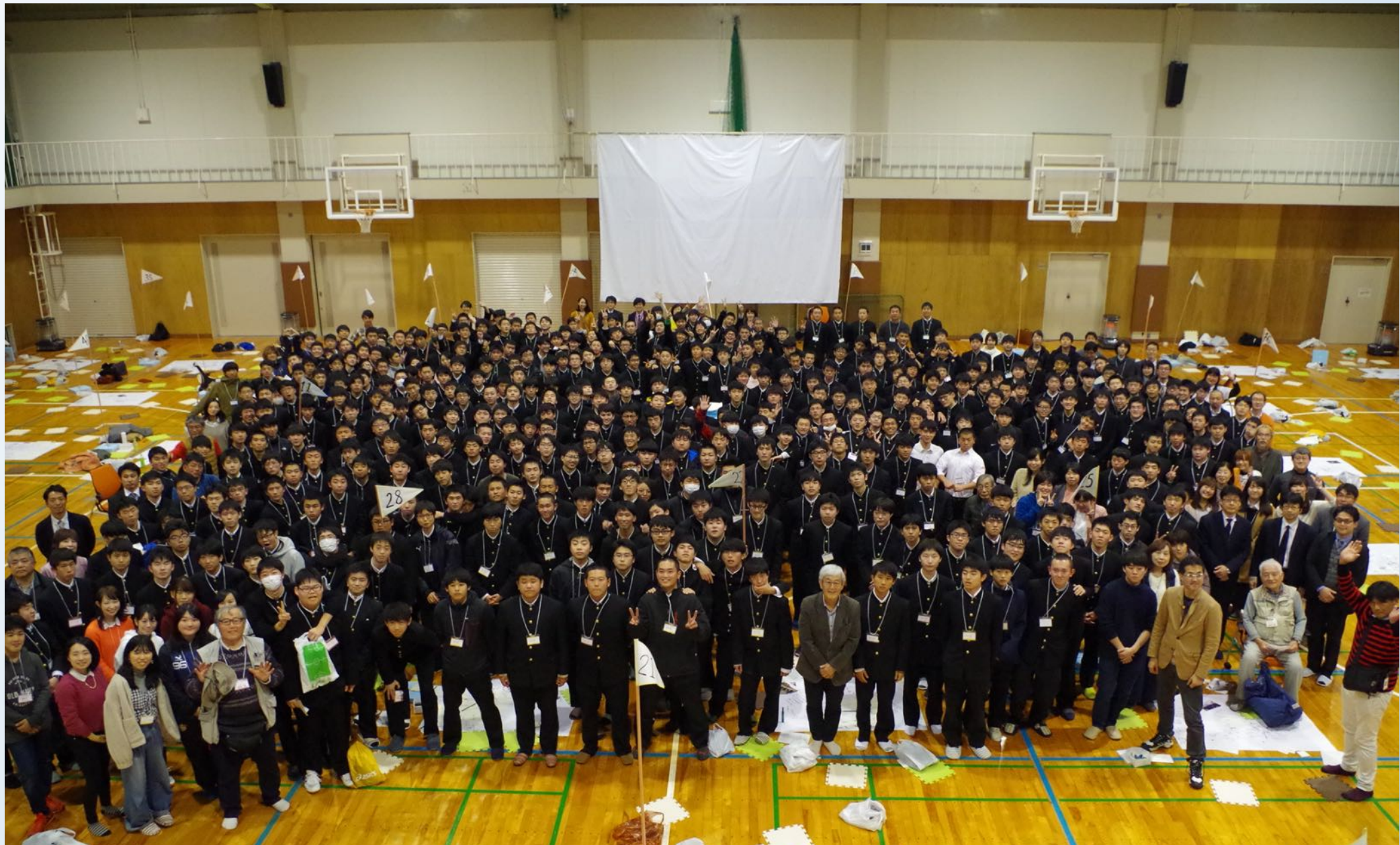
ESD修学旅行受入（東北学院高校）